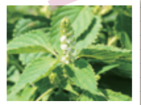
エゴマはシソ科の一年草で、実はゴマの様なイメージです。

エゴマは古くから「じゅうねん」とも言われるように、これを食べると10年寿命が延びると言い伝えられています。その理由はエゴマに多く含まれるα-リノレン酸を摂取すると、体内でEPAに変換されいわゆる血液サラサラ成分になる為で、健康に非常にプラスになるからなんです!