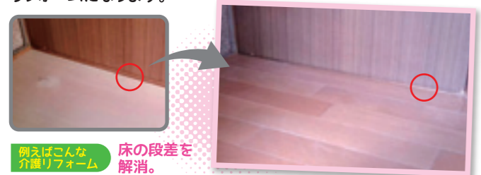
例えばこんな介護リフォーム 床の段差を解消。

介護リフォーム豆知識 要介護者だけでなく一緒に暮らす家族にとっても安全でラクな家。 体の機能が劣ったお年寄りや、体に障がいをもつ人にとって、家のなかのちょっとした段差がケガの原因になったり、辛い階段の昇り降りが行動範囲を狭くします。そこで、これらを解消し、安全に快適に動けるよう段差をなくし、手すりを設けるのがバリアフリーリフォームです。このバリアフリーに加え、浴室やトイレに自力で行けるよう、また介助される方の負担が軽減できるように、居室に隣接させることや、補助となる手すりを設置すること、また廊下・出入りに十分なスペースを確保することなどが基本的な介護リフォームになります。